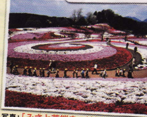
写真:「みさと芝桜まつり」4月上旬～5月上旬