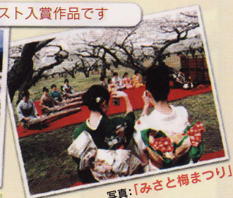
写真:「みさと梅まつり」